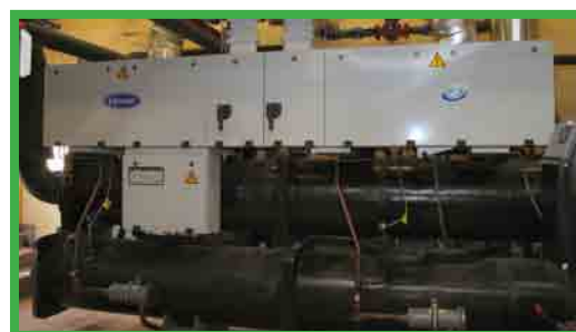
Carrier värmepump 30HXC "Global Chiller" placerad i maskinrummet hos Tågerups Trädgård.