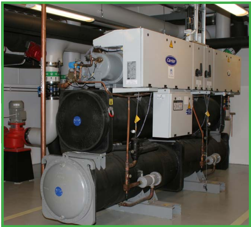
30HXC "Global Chiller" med fyra kompressorer, arbetar med både värme- och kylproduktion på Kemicentrum och Designcentrum, Lunds Universitet.